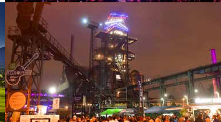
Colours of Ostrava