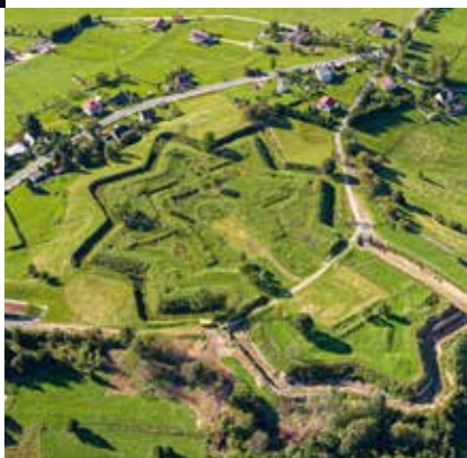
Historické opevnění Šance