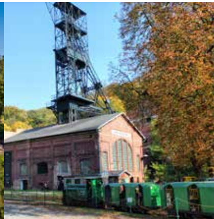
Hornické muzeum Landek Park